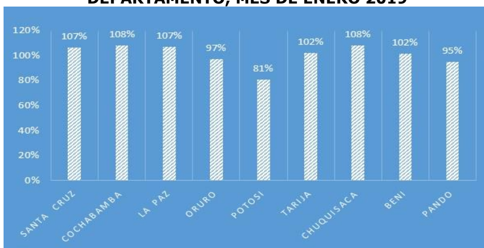
GRAFICO N° 04 CUMPLIMIENTO DE METAS EN LA RECAUDACION POR DEPARTAMENTO, MES DE ENERO 2019

En el cumplimiento de metas de las recaudaciones programadas para el mes de enero del 2019, los Departamentos de Cochabamba y Chuquisaca son los que alcanzaron los niveles más altos, 108% aproximadamente, seguidos de Santa Cruz y La Paz (107% en promedio), en tanto que Potosí presenta el indicador de cumplimiento más bajo, alcanzando tan solo el 81%, tal como se puede observar en el siguiente gráfico.