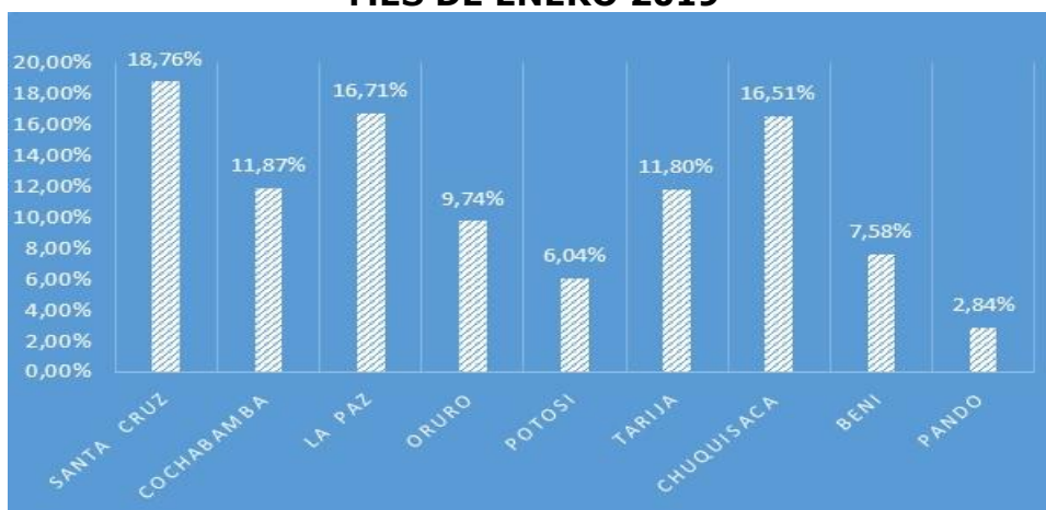
GRAFICO N° 03 CRECIMIENTO DE LA RECAUDACION POR DEPARTAMENTO MES DE ENERO 2019

El grafico muestra e identifica claramente a tres departamentos que presentan indicadores de crecimiento, como los más altos, Santa Cruz (18,76%), La Paz (16,71%) y Chuquisaca (16,51%) en tanto que Pando presenta el indicador de crecimiento más bajo a nivel nacional.